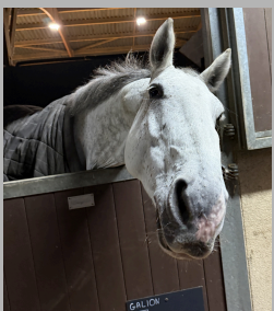
GALION du ROUET