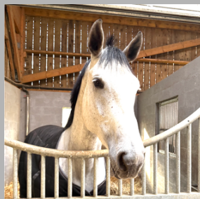
CALEDONIA PIXY Z